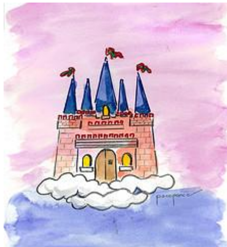
Dibujo de Francisco Ponce Carrasco.

Un cuento fantástico con princesas aburridas, príncipes viajando sobre dragones, encantamientos, y demás entretenimientos para un reino que te resultará, raro, diferente y muy particular.